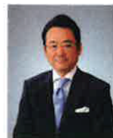
医療法人社団博栄会