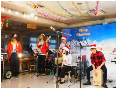
去年のクリスマスコンサートです。