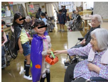
写真は利用者様のご了解済みです。