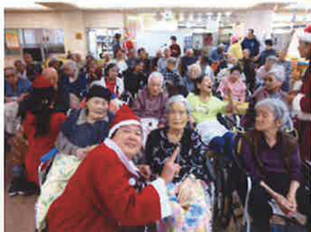
(昨年のクリスマス会の様子より)